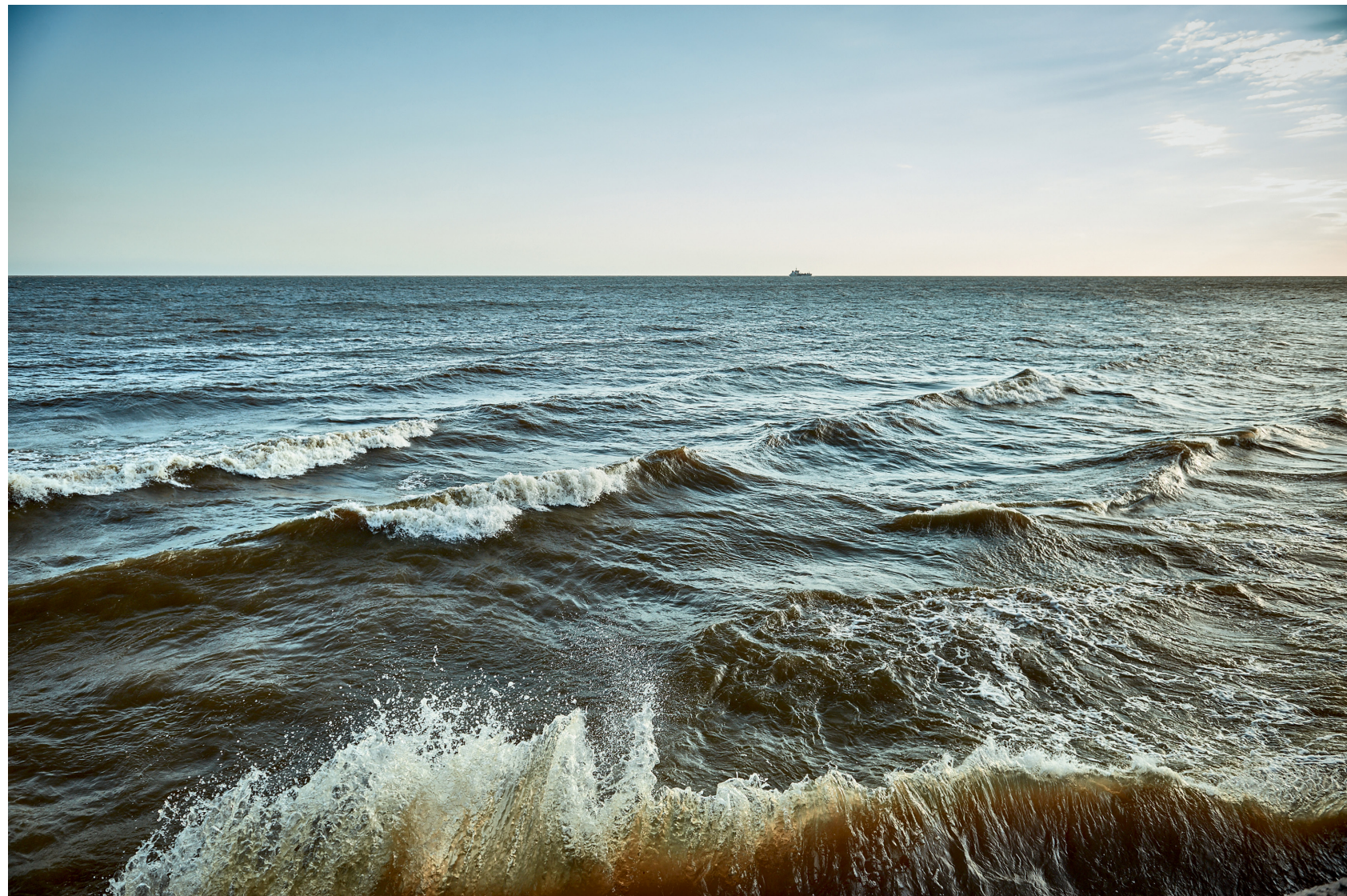
Ancho como mar 2014