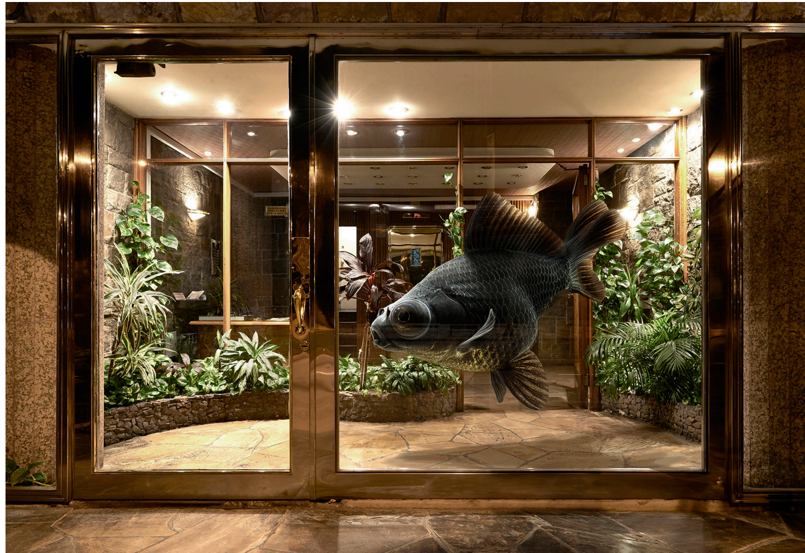
Traiganme la noche 2015