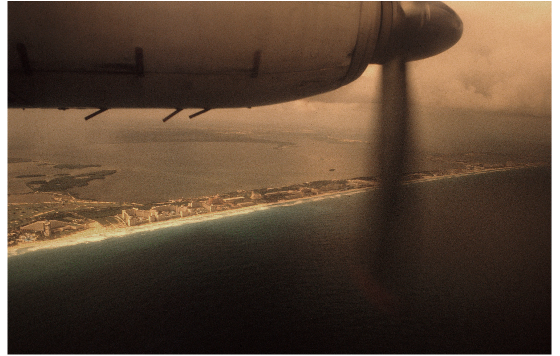
Cancun, La Habana, Cancun 1998