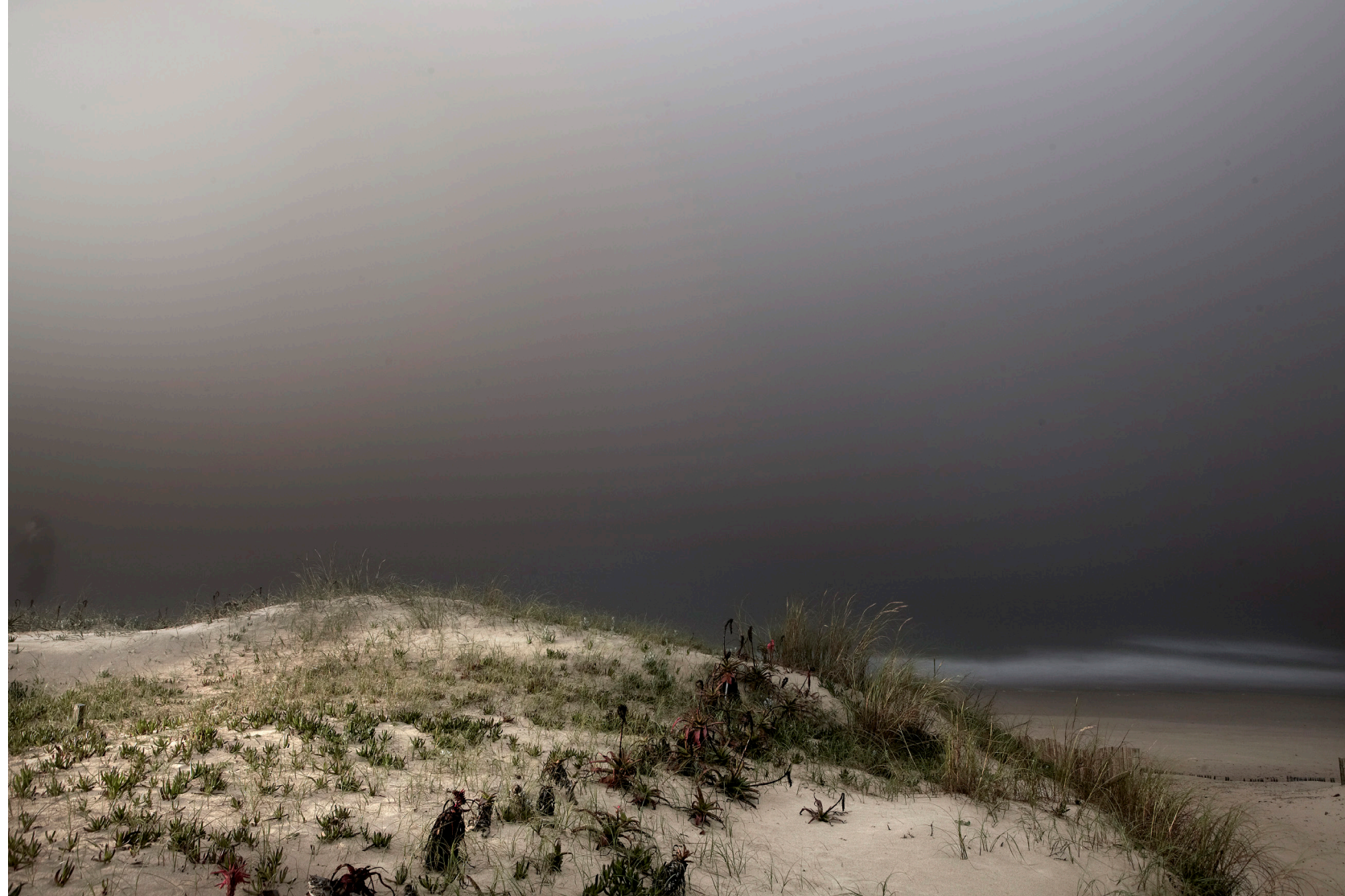
Duna de Maria Virginia 2012