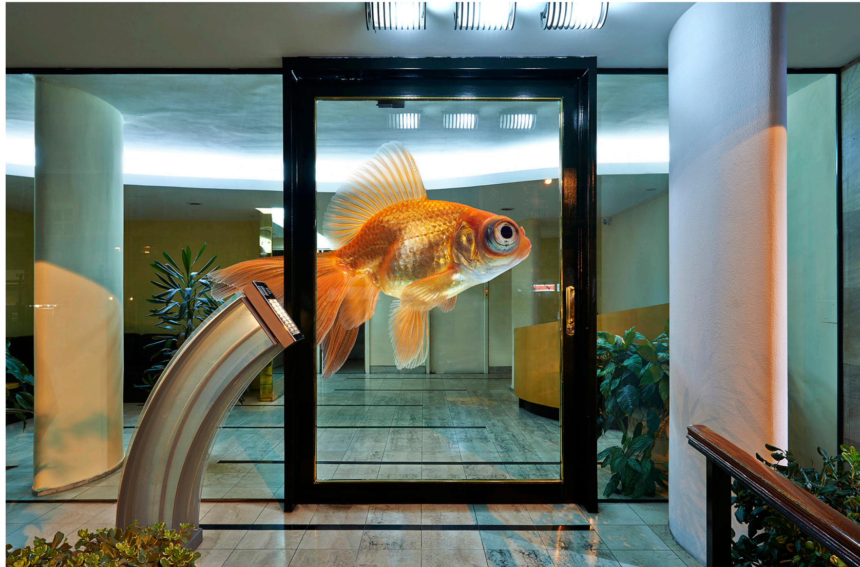
Temprano a casa 2015