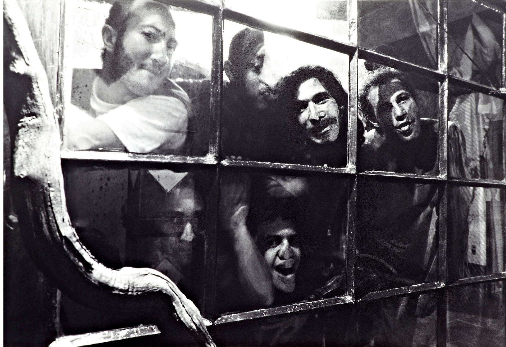
Casa tomada 1992