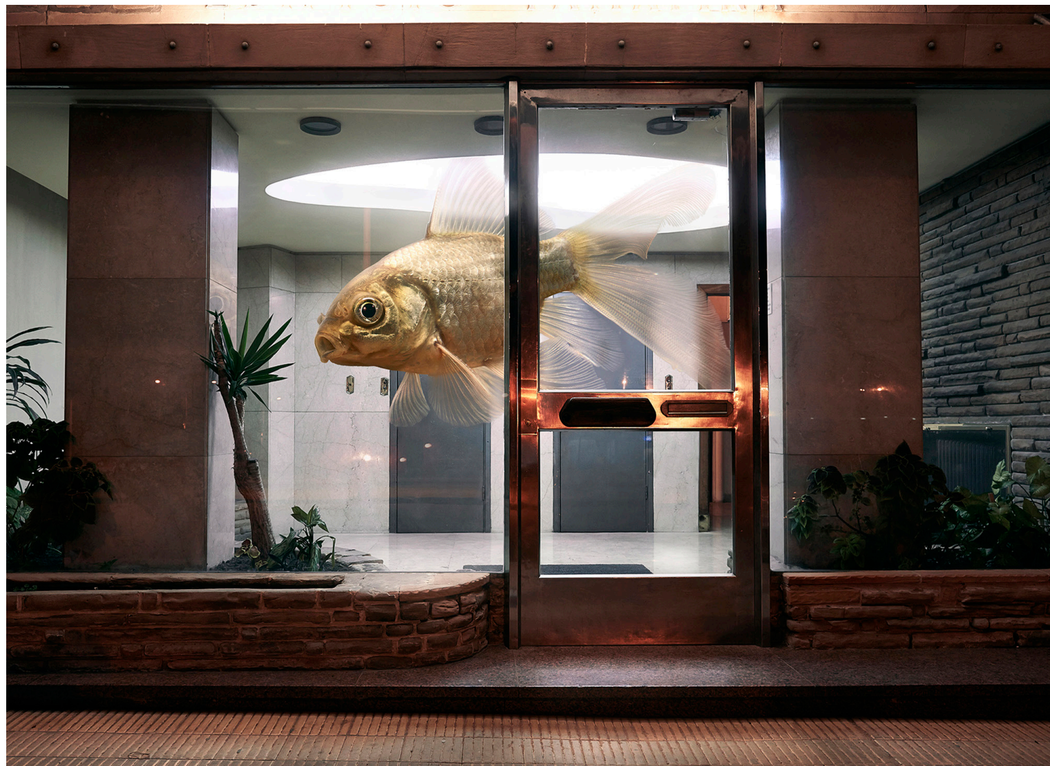
Volar, ni lo sueñes 2013