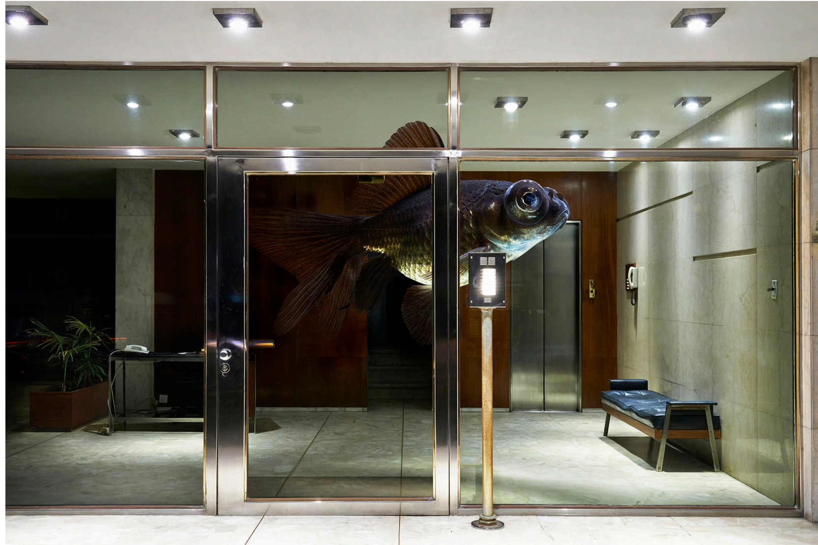
Flotar, ni lo sueñes 2015