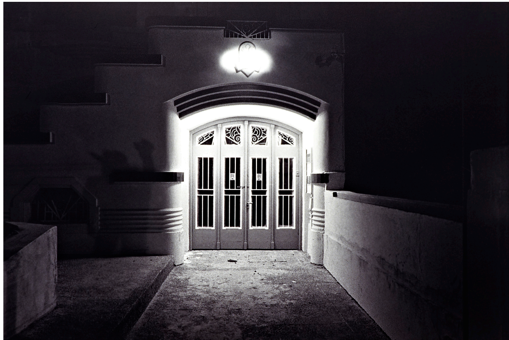
La puerta de la Iguana 1992