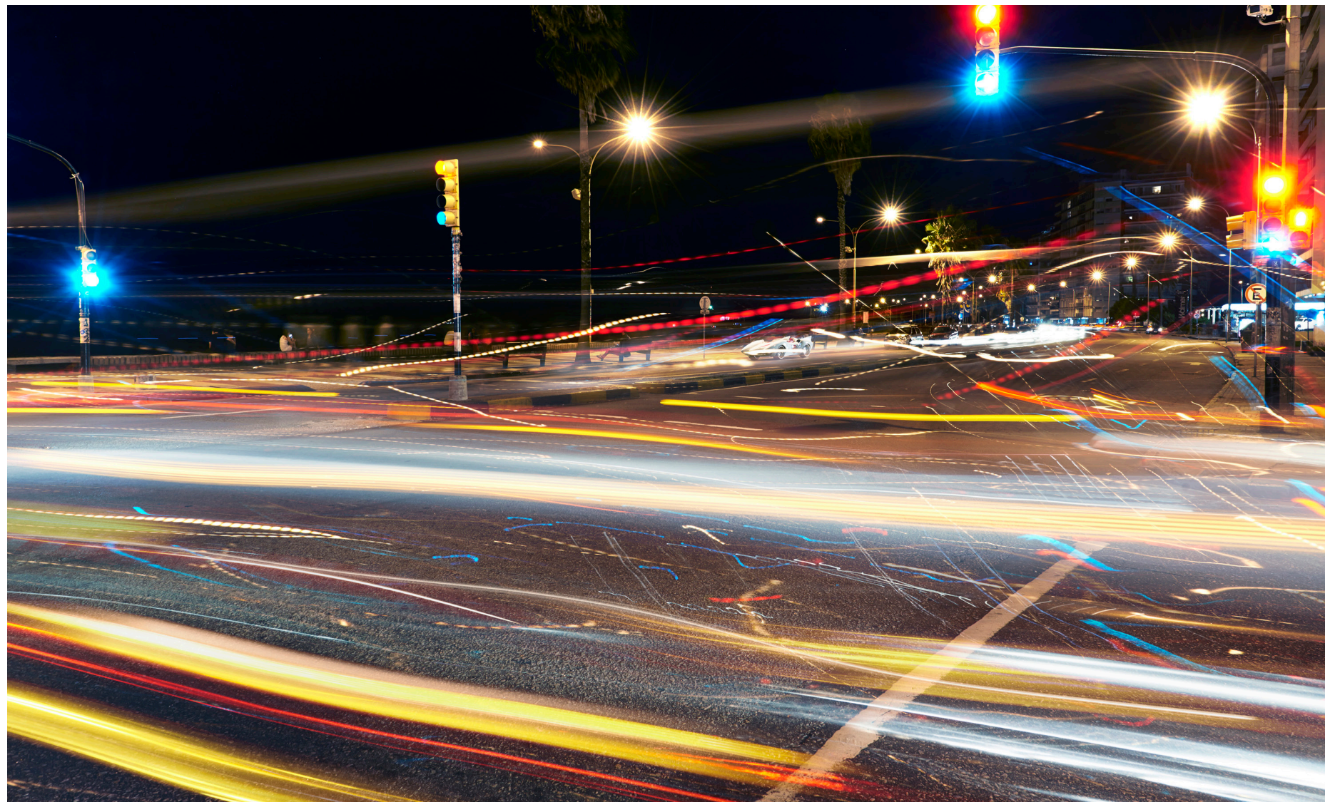
Auto de carreras 2015