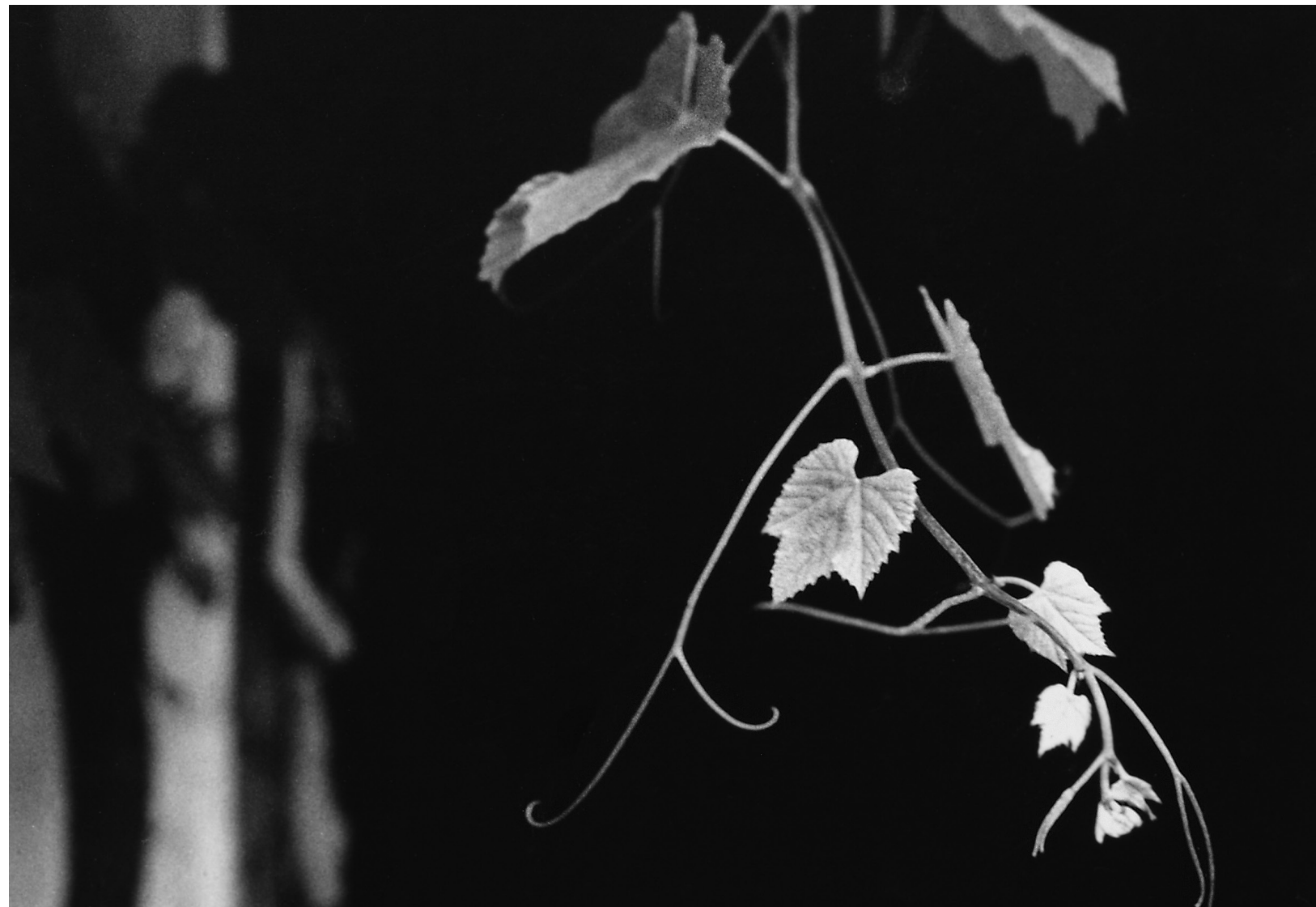
El jardín de Velazco 1992