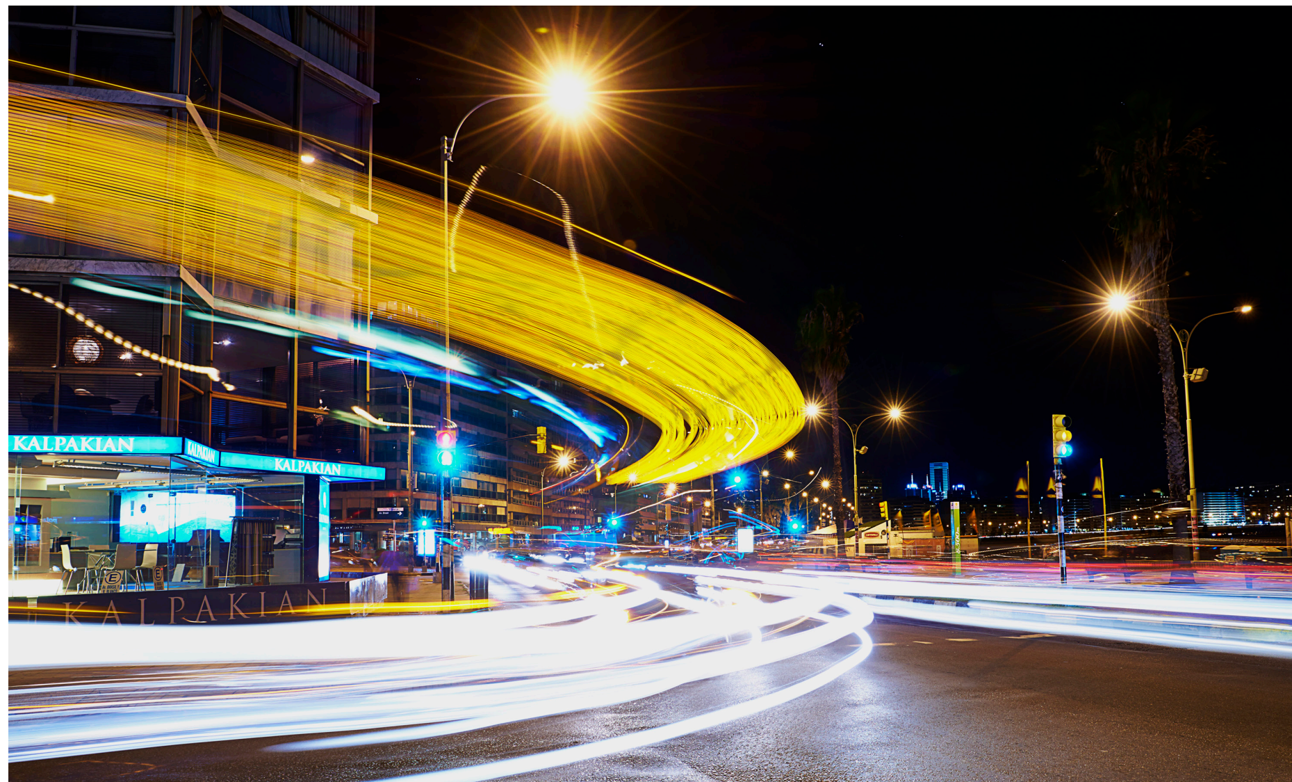
Kalpakian, el 104 y un pilar 2015